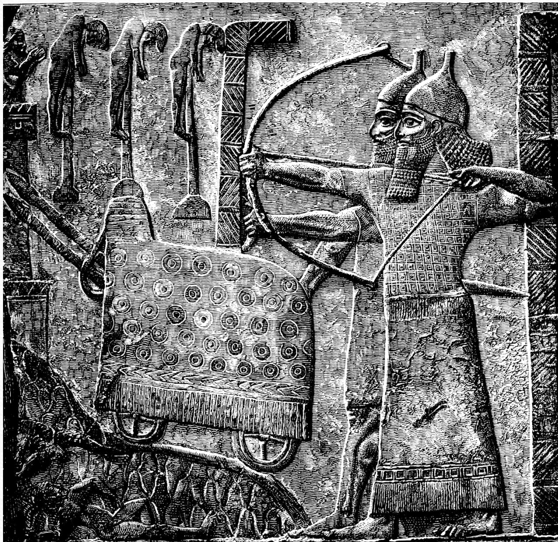
Тиглат-Пилесер III у опсади града, рељеф из Ниниве