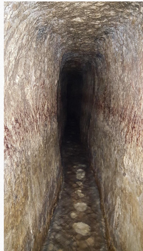
Језекијин тунел и натпис, крај 8. в. пХ