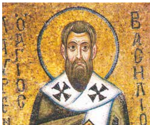
Св. Василије Велики, мозаик из Цркве Св. Софије у Кијеву, 11. век

Како доћи до квалитетног богословског образовања? Сагледајмо проблеме и што пре кренимо да их решавамо