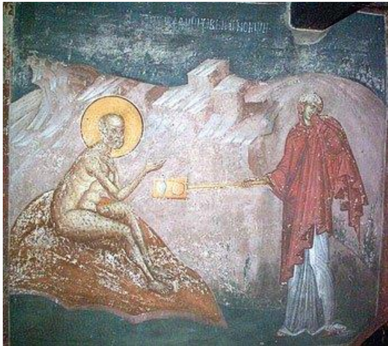
Фреска Јов на ђубришту – манастир Грачаница 1320.