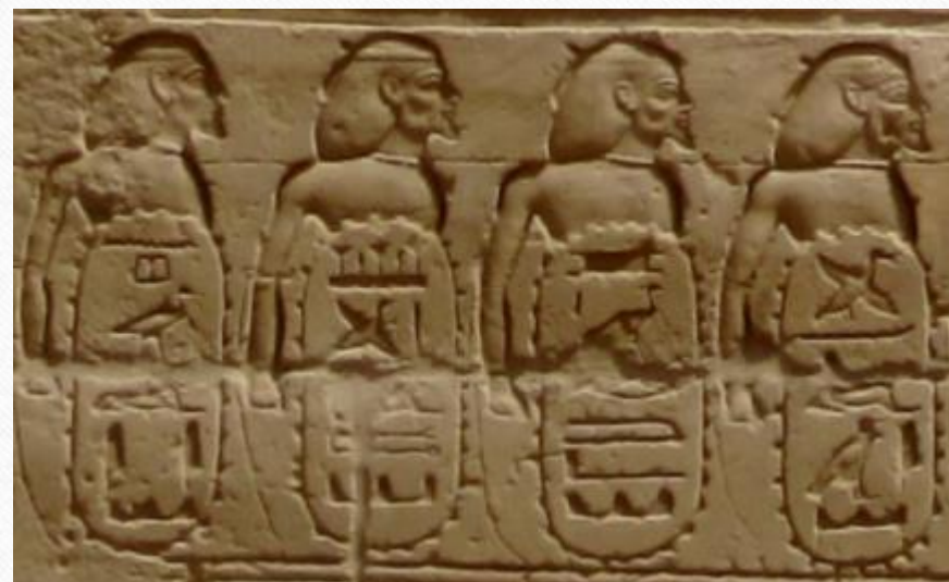
Тријумфални рељеф у Карнаку (Бубастис портал) на којем је осликана Сисакова победа